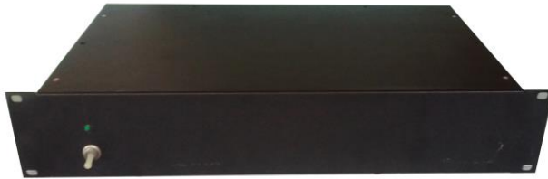
Рис. 3. Блок живлення з акумуляторною батареєю для автономного живлення радіорелейної станції

Б) радіорелейна станція терагерцового діапазону: