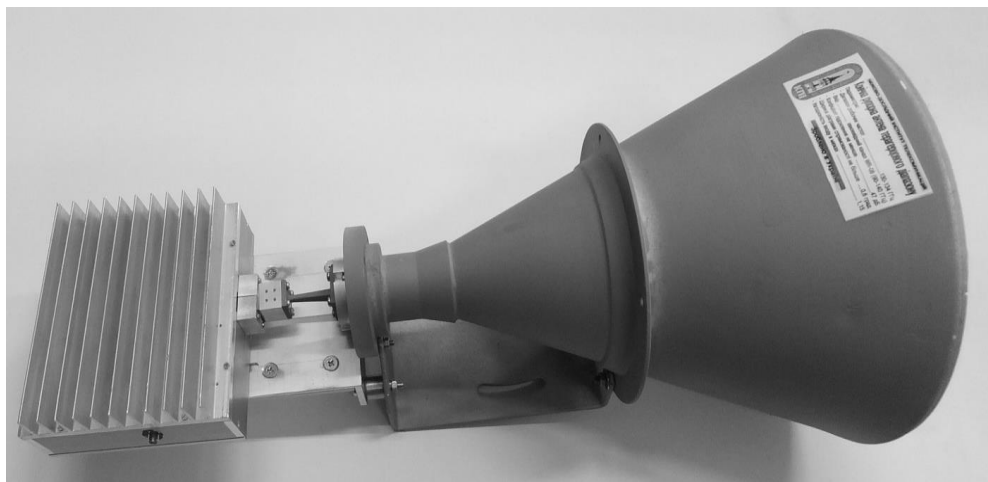
Рис. 5. Приймопередавач групового сигналу в діапазоні 130 ГГц з направленою антеною для радіорелейної лінії зв'язку