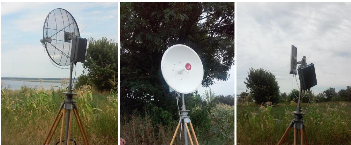
Рис. 1. Вузьконаправлені, та секторна антена 120град. на шпильі

А) Радіорелейна станція широкосмугового доступу: