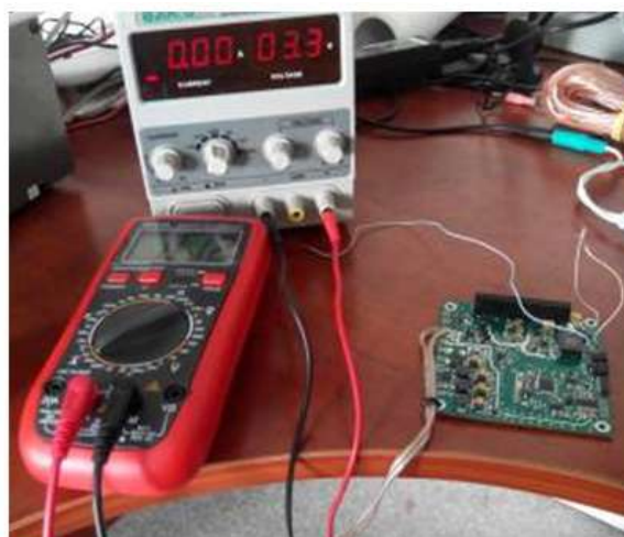
Вимірювання параметрів плати системи електроживлення наносупутника