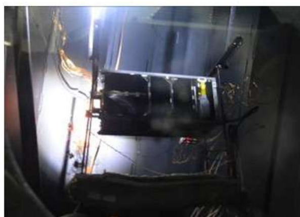
Наземні випробування НС у термовакuumній камері