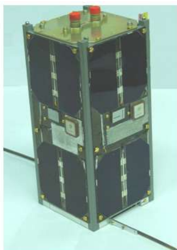
Загальний вигляд НС